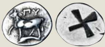
Abbildung auf 150% vergrößert!