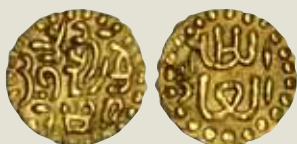
Abbildung auf 150% vergrößert!

'Ala al-Din bin 'Ali (1537-1571, AH 944-979)