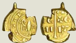
Abbildung auf 150% vergrößert!

Friedrich II. von Hohenstaufen (1198-1250)