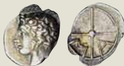
Abbildung auf 150% vergrößert!