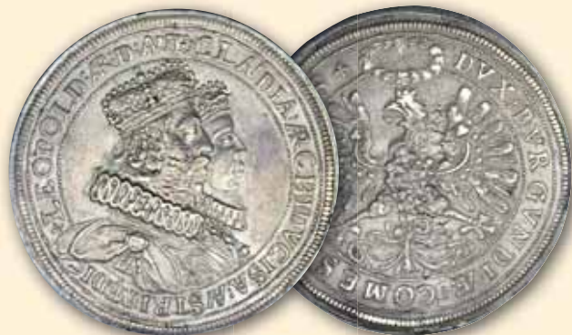
Erzherzog Leopold V. Doppeltaler ohne Jahr (1626) Hochzeit mit Claudia von Medici ss 790,- € □

* 9. Oktober 1586 in Graz; † 13. September 1632 in Schwaz, Tirol Aus dem Haus Habsburg, er war der Sohn von Erzherzog Karl II., Bischof von Passau und Straßburg (bis 1625), von 1614 bis 1625 Abt von Kloster Murbach. Während seiner Zeit als Geistlicher war er Stadthalter, später Landesfürst von Tirol. 1625 zog er sich von seinen geistlichen Ämtern zurück und heiratete 1626 Claudia von Medici. Diesem Florentiner Geschlecht entstammten französische Königinnen und Päpste.