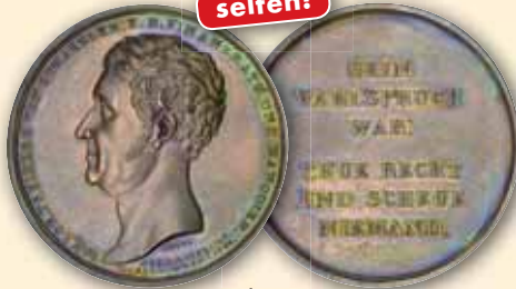
Ludwig I. Bronze-Medaille 1826, von Neuss. Auf den Tod des bayerischen Finanzrates und Banquiers Freiherr von Schaezler (Augsburg) Kopf links / Schrift vz 120,- € □