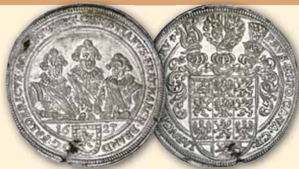
Friedrich, Albrecht und Christian Reichstaler 1627 vz+ kl. Schrötungsriß und -fehler 450,- € □