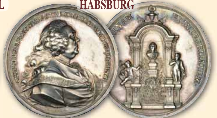
Maria Theresia Silber-Medaille 1772, von Widemann Auf den Tod ihres Leibarztes Gerard van Swieten Sein Brustbild rechts / Denkmal vz kl. Kratzer 690,- € □