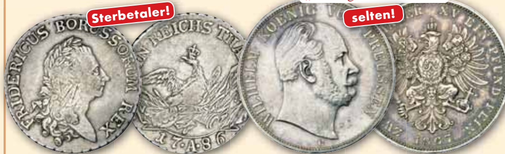
Friedrich II., der Große Reichstaler 1786, Berlin „Sterbetaler“ ss min. justiert 225,- € □