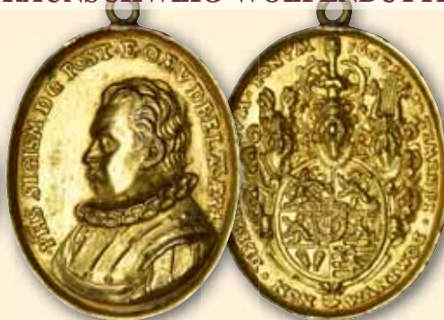
Philipp Sigismund Galvano der ovalen Medaille 1602, von M. Carl?. Geharnischtes Brustbild mit Mülsteinkragen links 5-fach behelmtes Wappen ss-vz Alte Öse, vergoldet 150,- € □