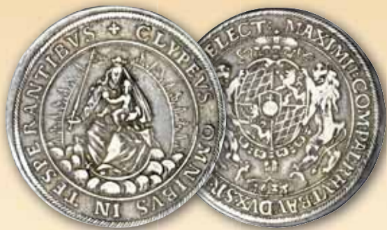
Maximilian I. Reichstaler 1625, München ss 490,- € □