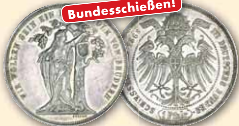
Franz Joseph Gedenktaler 1868 3. Deutsches Bundesschießen Thun 461 vz+ 340,- € □