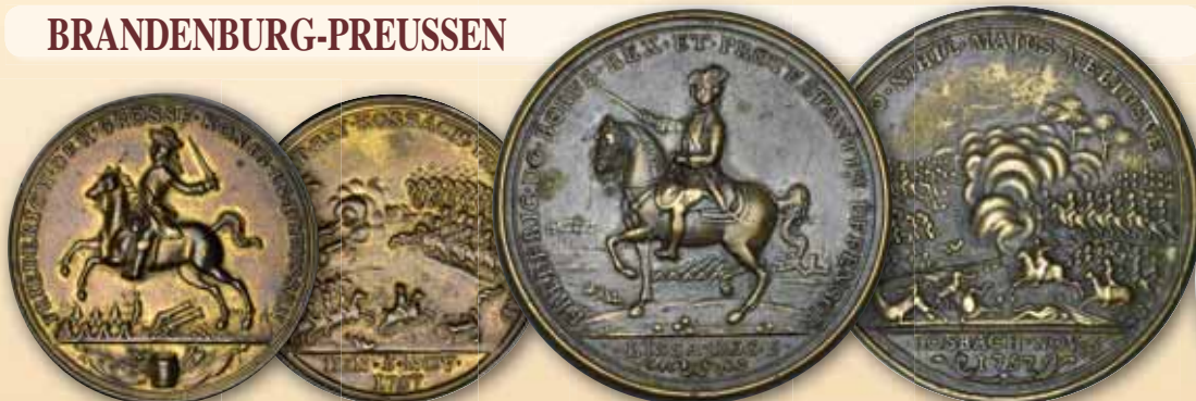
Friedrich II., der Große, Bronze-Guß-Medaille 1757 Auf den Sieg bei Roßbach Der König zu Pferd links, dahinter Feldlager Darstellung der Schlacht ss-vz 90,- € □