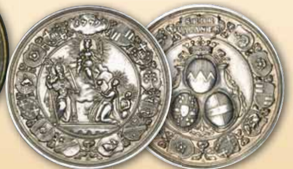
Sedisvakanz (1779) Medaille 1779, von Götzinger vz 390,- € □