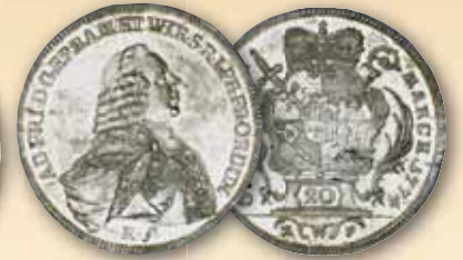
Adam Friedrich von Seinsheim 20 Konventionstaler 1774 st justiert 490,- € □ st 750,- € □