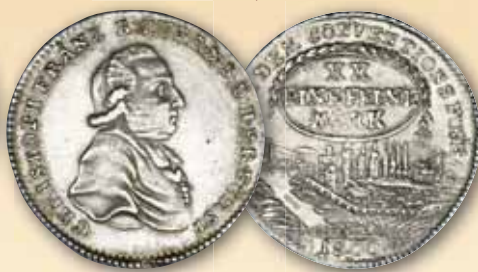
Christoph Franz von Buseck 1/2 Konventionstaler 1800, Nürnberg ss-vz 250,- € □