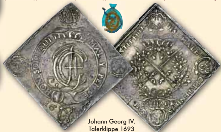
Johann Georg IV. Talerklippe 1693 Auf das Schießen bei der Verleihung des Hosenbandordens ss 695,- € □