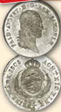
Friedrich August III. (I.) 1/6 Taler 1808 SGH stgl justiert 150,- € □