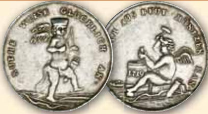
Friedrich August I. „der Starke“ Silberabschlag vom 3 Dukaten 1719 Auf die Vermählung seines Sohnes August mit Erzherzogin Maria Josepha von Österreich. Ausbeute • RUTHE WEISE GLÜCKLICH AN • Cupido mit Wünschelrute rechts • DAS ICH AUS BEUT MÜNTZEN KAN • Rechts sitzender Münzen schlagender Cupido ss+ kl. Randfehler 480,- € □