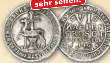
Christian Friedrich und Jost Christian I. 6 Mariengroschen 1714 ss 315,- € □