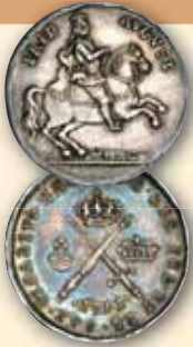
Friedrich August I. „der Starke“ Silberabschlag vom Dukaten 1711 Auf das Vikariat vz 980,- € □