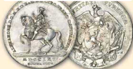
Alexander Konventionstaler 1765, Schwabach Auf die Kreisobristenwürde ss 795,- € □ vz 980,- € □

Der Kreisobrist war ein Amt in den Reichskreisen des Heiligen Römischen Reichs deutscher Nation in der Frühen Neuzeit.