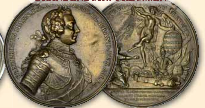
Friedrich II., der Große Bronze-Guß-Medaille 1757. Auf den Sieg bei Prag. Brustbild im Harnisch rechts / Blitzes schleudernde Victoria über Armaturen. Links kniende Bohemia ss Randfehler 50,- € □ vz 75,- € □