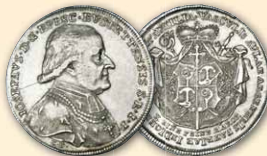
Joseph von Stubenberg Konventionstaler 1796, München von Destouches ss-vz 425,- € □