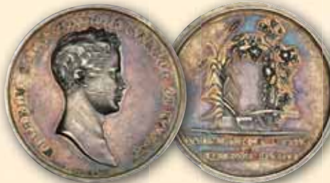
Wilhelm Silber-Medaille ohne Jahr (1816), von Zollmann Prämie des Landwirtschaftlichen Vereins Kopf rechts / Pflanzen und Geräte über Schrift ss-vz kl. Kratzer 150,- € □