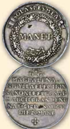
Johann Georg III. 1/4 Taler 1687, Dresden Auf den Tod seiner Mutter Magdalena Sibylla von Brandenburg ss+ kl. Schrötungsfehler 275,- € □

Der Hosenbandorden gestiftet vom englischen König Eduard III. 1348. Dieser ist der exklusivste Orden des Vereinigten Königreichs und einer der angesehensten Europas. Zu seinen bekanntesten Mitgliedern zählen: Napoleon III. (Frankreich), Christian IX. (Dänemark), Sir Winston Churchill, Sir Edmund Hillary.