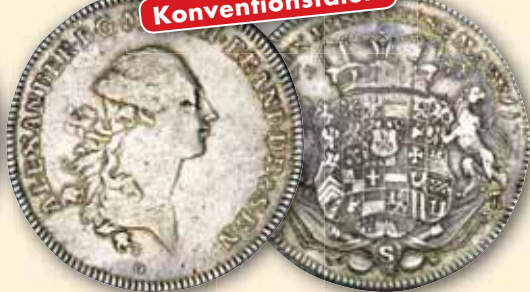
Christian Friedrich Karl Alexander Konventionstaler 1771, Schwabach ss 295,- € □