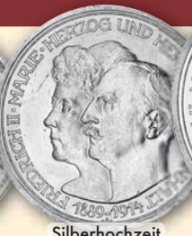
Silberhochzeit 3 Mark 1914 J.24 ss-vz 78,- € □ vz-bfr 110,- € □