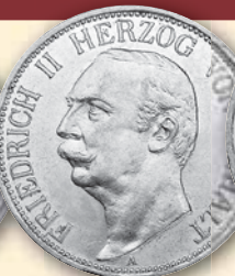
Friedrich II. 3 Mark • J.23 vz+ kl. Randf. 1909 145,- € □ ss kl. Randf. 1911 98,- € □