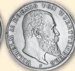
Wilhelm II. 3 Mark J.175 vz+ 1910 32,- € □ vz-bfr 1912 35,- € □