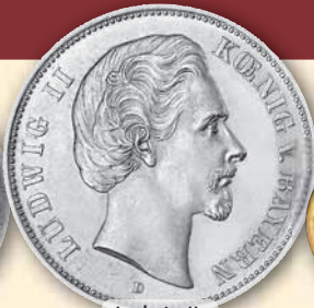
Ludwig II. 5 Mark • J.42 ss 1875 98,- € □ ss 1876 98,- € □ vz-bfr 1876 490,- € □