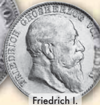
Friedrich I. 2 Mark • J.32 ss 1906 145,- € □ vz 1907 90,- € □ vz-bfr 1907 130,- € □