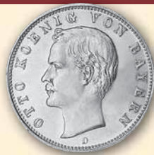
Otto 2 Mark • J.45 s-ss 1893 29,- € □ vz-bfr 1893 225,- € □ vz-bfr 1896 190,- € □ ss 1898 130,- € □ fast bfr 1899 195,- € □ bfr 1904 89,- € □ vz-bfr 1912 90,- € □