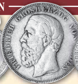
Friedrich I. 5 Mark 1875 J.27 s-ss 98,- € □