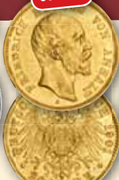
Friedrich I. 20 Mark 1901 J.181 vz 3.600,- € □