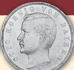
Otto 5 Mark • J.46 vz-bfr 1895 375,- € □ ss 1906 65,- € □ vz-bfr 1907 98,- € □