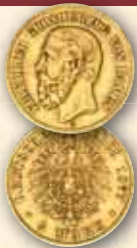
Friedrich I. 5 Mark 1877 J.185 ss 695,- € □