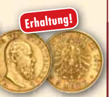
Karl • J.291 5 Mark 1877 ss 595,- € □ vz-bfr 895,- € □ bfr 1.090,- € □

Otto Wilhelm Luitpold Adalbert Waldemar von Wittelsbach, König von Bayern * 27. April 1848 in München † 11. Oktober 1916 auf Schloss Fürstenried