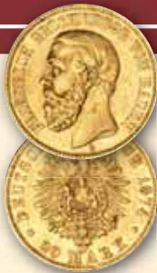
Friedrich I. 20 Mark 1874 J.187 ss 900,- € □