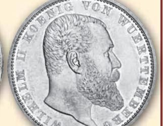
Wilhelm II. 5 Mark • J.176 ss 1906 89,- € □ vz-bfr 1913 98,- € □