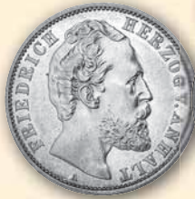
Friedrich I. 2 Mark 1876 J.19 s-ss 275,- € □