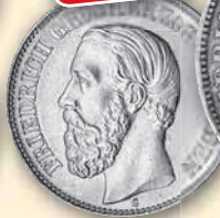
Friedrich I. 2 Mark • J.26 schön 1880 150,- € □ bfr 1888 3.450,- € □