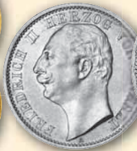
Friedrich II. 2 Mark 1904 J.22 ss-vz 495,- € □