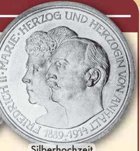
Silberhochzeit 5 Mark 1914 • J.25 ss-vz 295,- € □ vz (ex PP) 395,- € □ vz-bfr 445,- € □