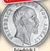
Friedrich I. 2 Mark 1876 J.20 ss 450,- € □ bfr 1.290,- € □