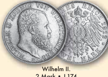
Wilhelm II. 2 Mark • J.174 ss 1899 35,- € □ vz-bfr 1900 98,- € □ vz-bfr 1907 70,- € □ fast bfr 1913 98,- € □ bfr 1913 125,- € □