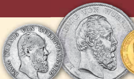
Karl • J.172 2 Mark ss 1877 189,- € □ kl. Randf. s-ss 1883 149,- € □