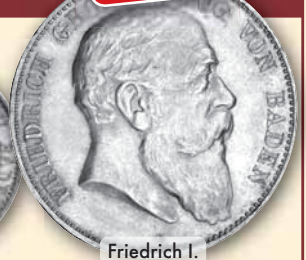
Friedrich I. 5 Mark • J.33 ss 1902 110,- € □ bfr 1903 925,- € □ vz kl. Randf. 1907 155,- € □