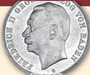
Friedrich II. 5 Mark • J.40 ss-vz 1908 98,- € □ vz-bfr 1913 195,- € □ fast bfr 1913 275,- € □