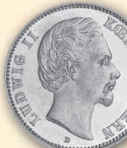
Ludwig II. 2 Mark • J.41 kl. Randf. schön+ 1880 95,- € □ vz 1883 690,- € □