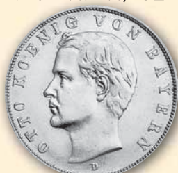
Otto 3 Mark • J.47 vz-bfr 1908 45,- € □ vz-bfr 1909 35,- € □ vz-bfr 1912 35,- € □

Otto Wilhelm Luitpold Adalbert Waldemar von Wittelsbach, König von Bayern * 27. April 1848 in München † 11. Oktober 1916 auf Schloss Fürstenried