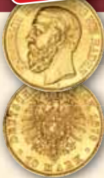
Friedrich I. 10 Mark 1875 • J.186 ss 298,- € □ bfr 1.300,- € □