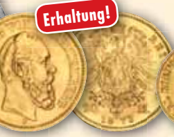
Karl • J.290 20 Mark 1873 ss-vz 450,- € □ vz-bfr 820,- € □ bfr 1.350,- € □