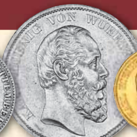
Karl • J.173 5 Mark ss 1876 98,- € □ s-ss 1888 110,- € □