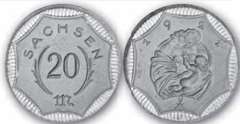
J. N 59

Ja, senden Sie mir die markierten Münzen zu. Mit meiner Unterschrift akzeptiere ich Ihre Versandbedingungen laut Farbkatalog.