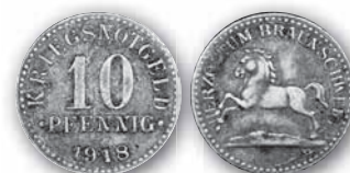
J. N 3b