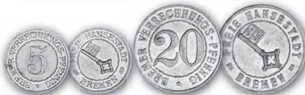
J. N 41