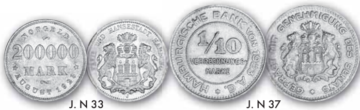
J. N 33