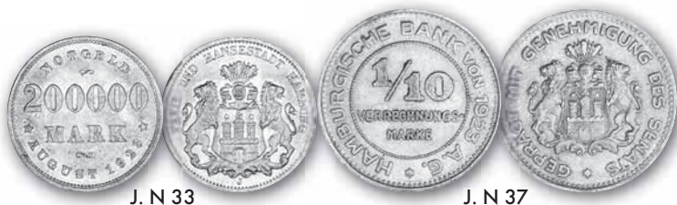
J. N 33