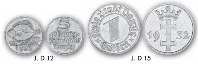
J. D 12