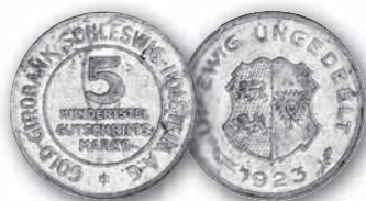
J. N 38