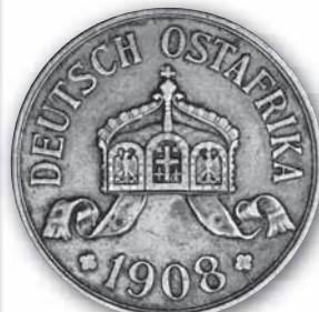
J. 717 Rückseite