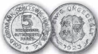
J. N 38