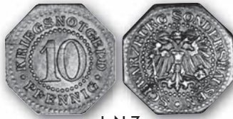
J. N 7