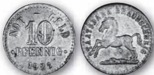
J. N 5