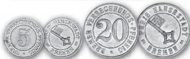
J. N 41