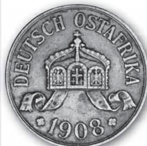
J. 717 Rückseite