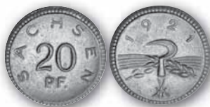
J. N 53