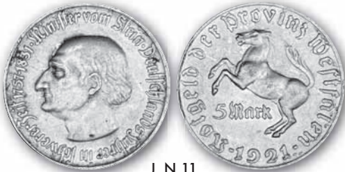
J. N 11