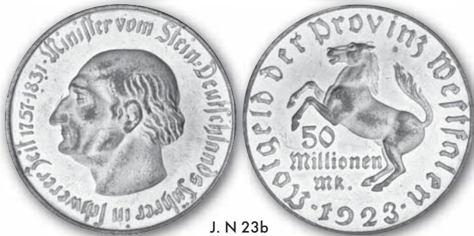
J. N 23b