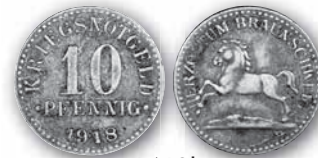
J. N 3b