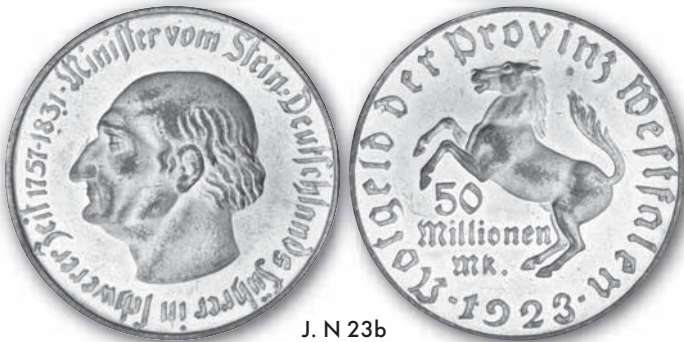
J. N 23b