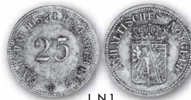
J. N 1

Jaeger N 1 25 (Pfennig) ohne Jahr 20,- € □