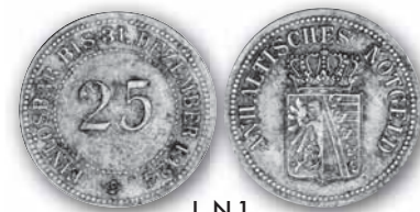
J. N 1

Jaeger N 1 25 (Pfennig) ohne Jahr 20,- € □