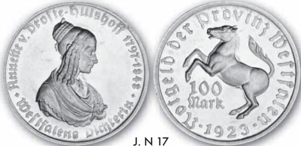
J. N 17