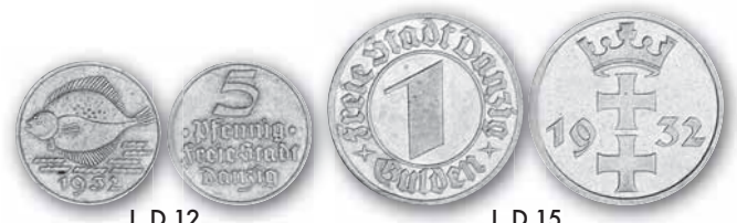
J. D 12