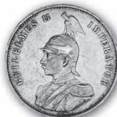
J. 722 Vorderseite