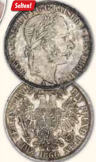
Franz Joseph I. Vereinsdoppeltaler 1866 A Wien • Thun 460 min. Kratzer vz+ 1.800,- € □