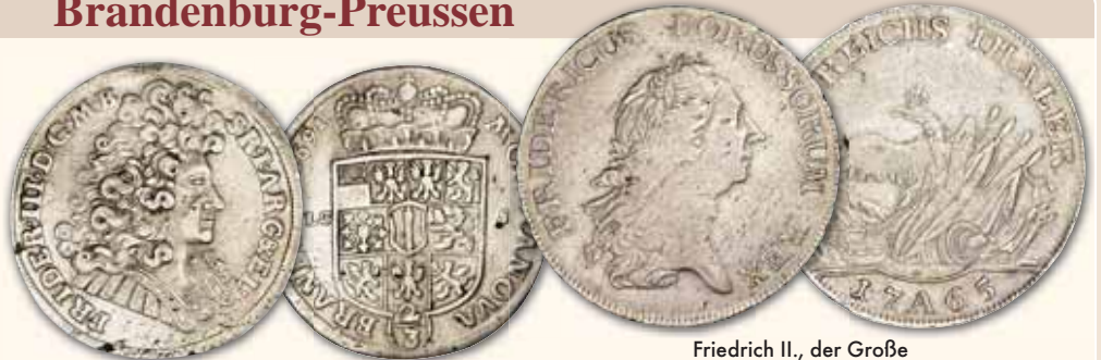
Friedrich III. (I.) 2/3 Reichstaler 1691 LC-S Berlin ss 185,- € □