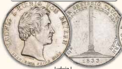
Ludwig I. Geschichtstaler 1833, München Thun 62 ss-vz 490,- € □

„Standbild Jean Paul Friedrich Richters errichtet zu Bayreuth 1841“