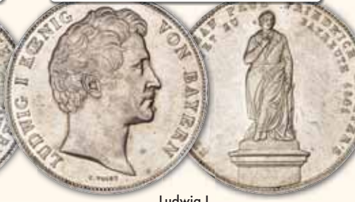
Ludwig I. Geschichtsdoppeltaler 1841, München Thun 79 ss-vz 425,- € □