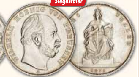
Wilhelm I. Vereinstaler 1871 A, Berlin Thun 272 ss 55,- € □ vz 75,- € □ vz-bfr 85,- € □ fast bfr 98,- € □