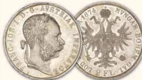
Franz Joseph I. 2 Florin 1874 Thun 458 vz-st 490,- € □