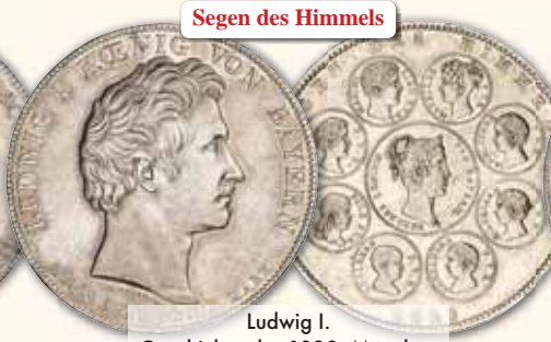
Ludwig I. Geschichtstaler 1828, München Thun 56 ss poliert, Henkelspur 150,- € □ ss-vz 350,- € □