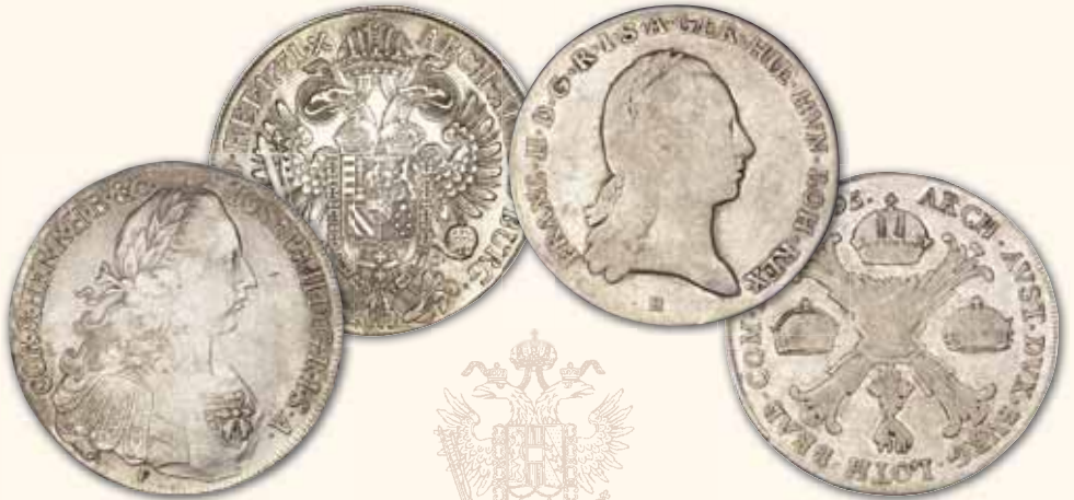
Joseph II. Konventionstaler 1771 F/A-S, Hall ss 550,- € □