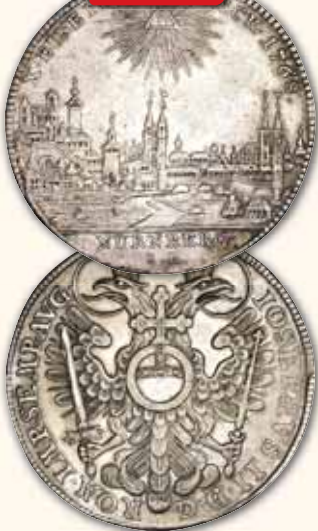
Konventionstaler 1768 SR Stadtansicht / Gekrönter Doppeladler, Reichsapfel auf der Brust Randschrift: DOMINE CONSERVA NOS IN PACE ss+ 395,- € □ mit Laubrand vz kl. Kratzer 550,- € □