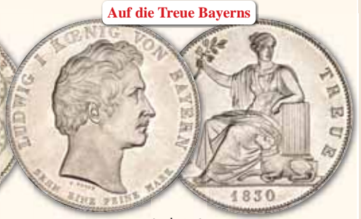
Ludwig I. Geschichtstaler 1830, München Thun 58 fast st 1.200,- € □

„Denkmal der Dreyssig Tausend Bayern welche im Russischen Kriege den Tod fanden“