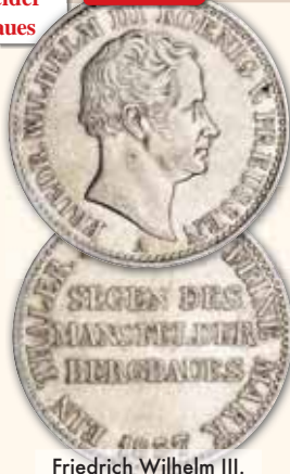
Friedrich Wilhelm III. Taler, Berlin • Thun 251 1835 A ss 140,- € □ 1837 A ss 140,- € □ 1840 A ss 140,- € □