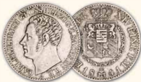
Carl Friedrich Taler 1841 A, Berlin Thun 384 ss 195,- € □