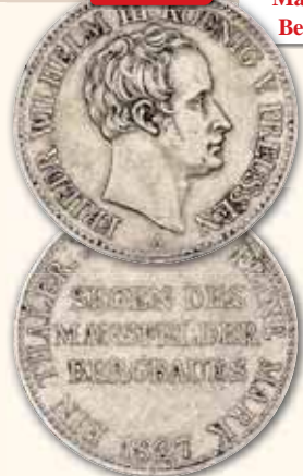
Friedrich Wilhelm III. Taler, Berlin • Thun 248 1827 A ss 140,- € □ 1828 A ss 140,- € □