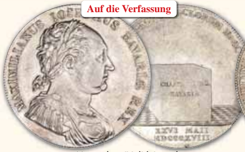
Maximilian IV. (I.) Joseph Konventionstaler 1818, München Thun 45 vz 325,- € □