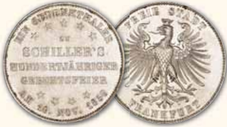
Vereinstaler 1859 Thun 139 Winziger Randfehler vz-bfr 195,- € □

Friedrich von Schiller Auf den 100. Geburtstag