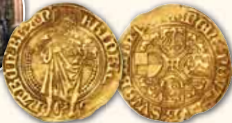
Friedrich der Ältere allein Goldgulden (1499), Schwabach 3,25 g Prägeschwäche ss 750,- € □