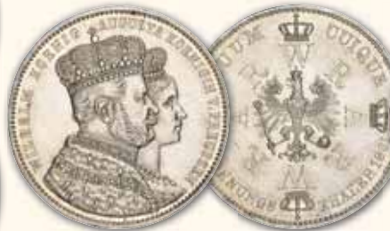
Wilhelm I. Vereinstaler 1861 A, Berlin Thun 265 ss 55,- € □ ss-vz 60,- € □ vz 75,- € □ vz-bfr 95,- € □