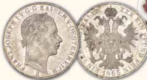
Franz Joseph I. Vereinstaler 1865 B, Kremnitz Thun 446 ss-vz kl. Kratzer 295,- € □

Mit 18 Jahren hat er den Thron bestiegen und 68 Jahre lang regiert. Kaiser Franz Joseph I. war der am längsten dienende Herrscher der Habsburger-Dynastie.