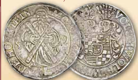
Volkmar Wolfgang, Eberwein und Ernst VI. Taler 1559, Ellrich „Ausbeute der Grube St. Andreas“ ss 750,- € □