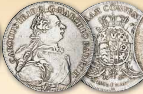
Karl Friedrich Konventionstaler 1765W, Durlach ss+ 325,- € □

Auf das Denkmal für seinen Vater Carl Friedrich