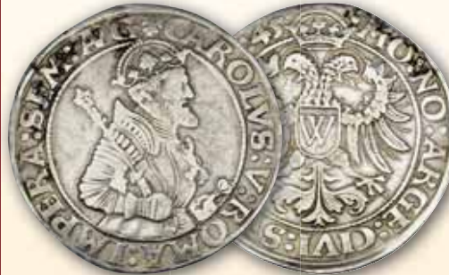
Taler 1545 ss 550,- € □

Donauwörth... auf diesem Taler wird die Stadt noch „Werda“ benannt (gleich Wörth = Insel in Flüssen oder Seen). Da es eine große Anzahl von Ortschaften mit diesem Namen gab erhielten sie meist noch einen geografischen Beisatz, in diesem Fall „Donau“.