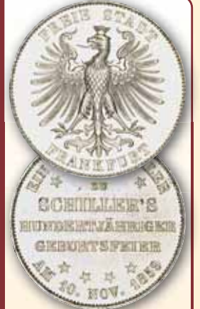
Vereinstaler 1859 „Auf den 100. Geburtstag von Friedrich von Schiller“ Thun 139 ss-vz 110,- € □