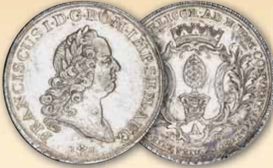
Konventionstaler 1765 von J. Thiébaud Pyr auf Podest in gekrönter Kartusche/ Kopf Franz I. nach rechts ss-vz 295,- € □