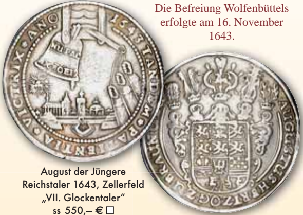
August der Jüngere Reichstaler 1643, Zellerfeld „VII. Glockentaler“ ss 550,- € □

Die Befreiung Wolfenbüttels erfolgte am 16. November 1643.