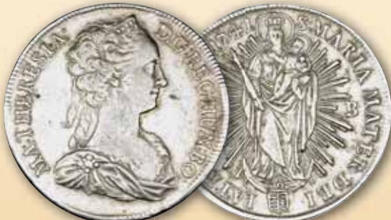
Maria Theresia Reichstaler, Kremnitz 1741 ss 325,- € □ 1742 ss 295,- € □