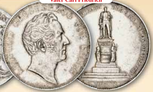
Karl Leopold Friedrich Doppeltaler 1844, Karlsruhe „Auf das Denkmal für seinen Vater Carl Friedrich“ Thun 25 ss 390,- € □

Auf das Denkmal für seinen Vater Carl Friedrich