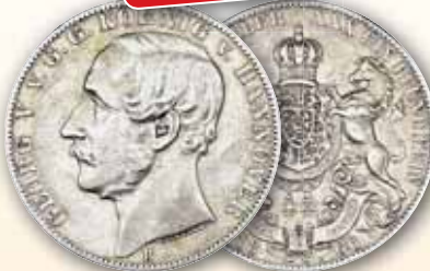
Georg V. Vereinstaler 1866 Hannover, Thun 174 ss 79,- € 74,- € □