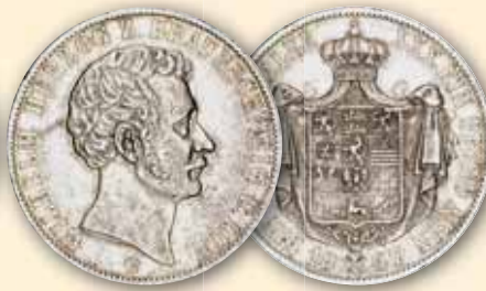
Wilhelm Vereinstaler, Braunschweig Thun 123 1858 B ss kl. Randfehler 90,- € □ 1867 B ss 98,- € □