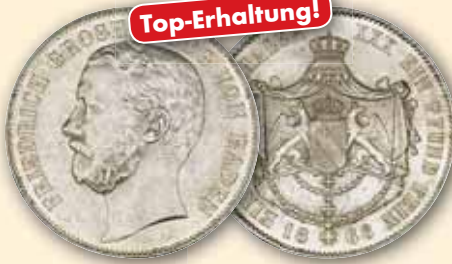
Friedrich (I.) Wilhelm Ludwig Vereinstaler 1866, Karlsruhe Thun 31 vz-bfr 450,- € □