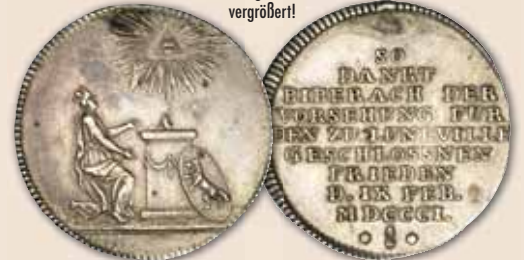
Abbildung auf 150% vergrößert!

Silberabschlag vom Dukaten 1801 „auf den Frieden von Luneville“ ss-vz gestopftes Loch 98,- € □